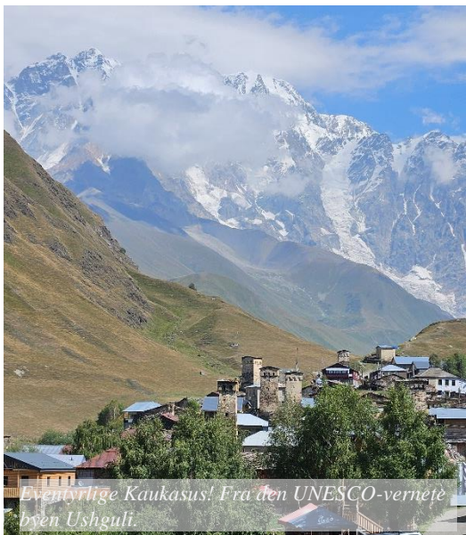
Eventyrlige Kaukasus! Fra den UNESCO-vernetede byen Ushguli.