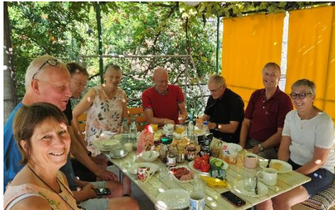
↑ En flott gjeng å feriere med! Her er det frokost under vinrankene utenfor det lille forhenværende hotellet vi leide i Tbilisi..