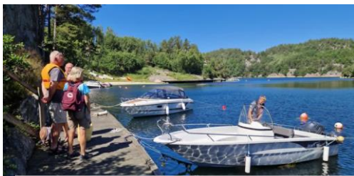
Den nye båten er en sann glede!