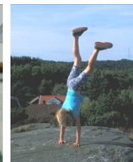
Eira på turnstevne i Enebakk, og med turntrening på et svaberg ved Brekkestø.