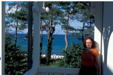
På fyrtårnbesøk ved kapp Arkona på Tysklands nordspiss

Fra en av terrassene på vår lekke ferieleilighet rett ut mot strandpromenaden i byen Binz